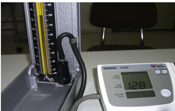
Figura 3 Cifras medias en mercurio y equipo automático conectados en «Y». El de mercurio marca 2 mm de Hg más que el equipo automático.

Con la perilla del equipo convencional se realiza el inflado del manguito una vez encendido el equipo que examinamos. Con el inflado la columna de Hg sube y los dígitos del automático también. Lentamente se inicia el desinflado manual, es suficiente con hacer dos o tres paradas en cifras altas, dos o tres en valores medios y dos o tres en cifras bajas de PA y comprobar que los datos de la columna de Hg coinciden con